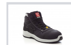
S0000 TOTAL BLACK