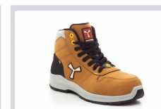
S0100 GIALLO ASPEN